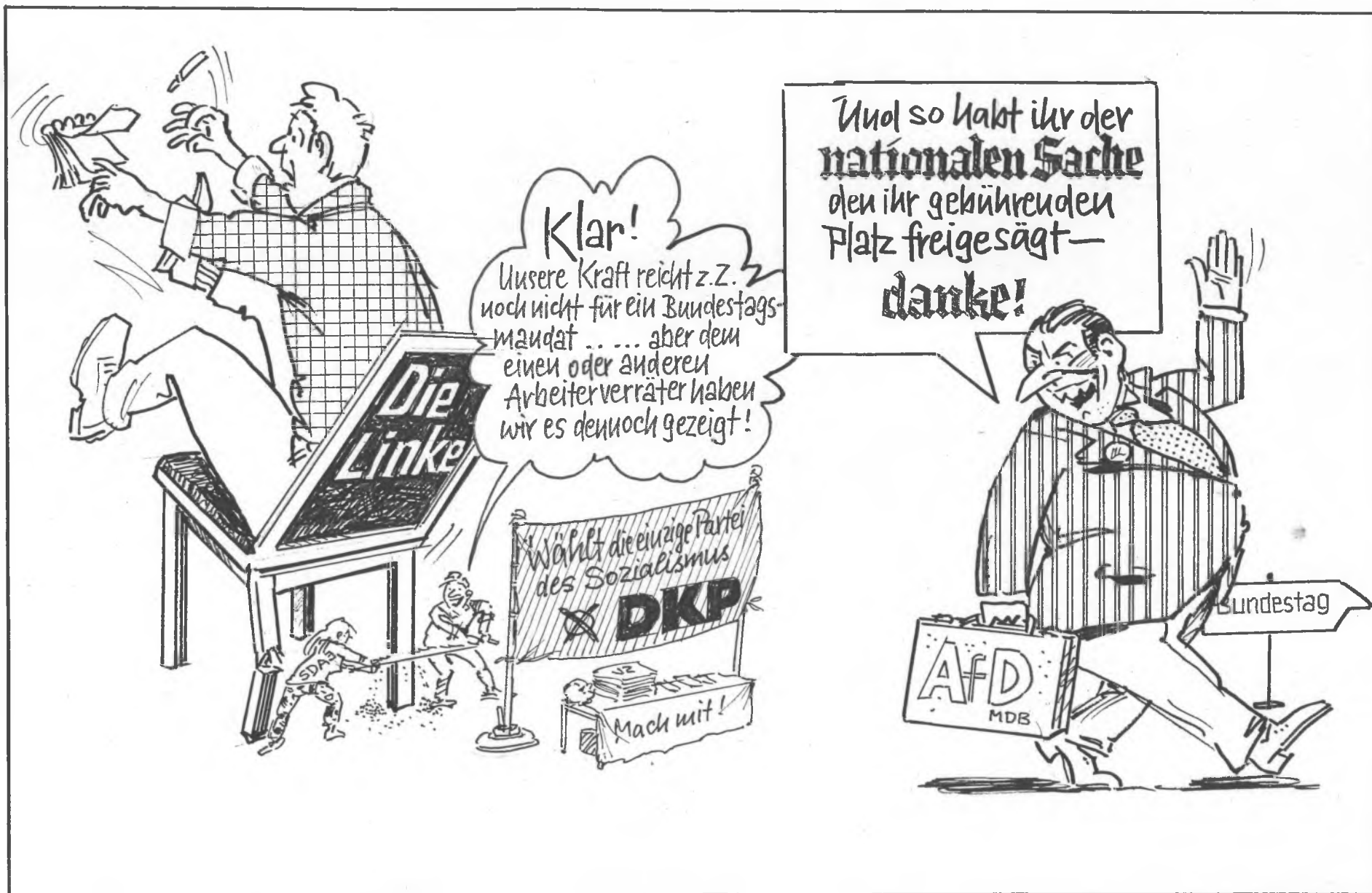
Flächendeckende Eigenkandidatur der DKP bei der Buta-Wahl 2017, damit das Proletariat für den Sozialismus stimmen kann