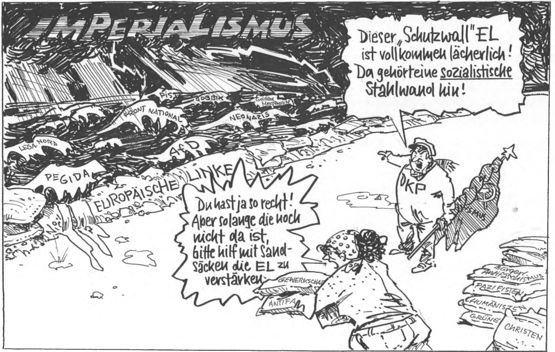
Ausscheiden aus der Europäischen Linken EL, weil diese kein sozialistischer Zusammenschluss ist - und EU-Gelder erhält